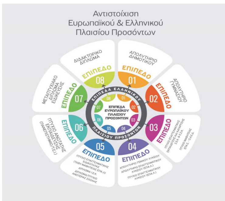
Πίνακας 1. Τύποι Προσόντων

Τα επίπεδα των τίτλων σπουδών που χορηγούν τα ελληνικά εκπαιδευτικά ιδρύματα και η αντιστοιχή τους με το Ευρωπαϊκό Πλαίσιο Προσόντων είναι τα παρακάτω: